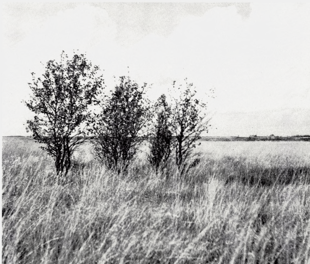
Fig. 19. Unge bævreaspe på den østlige del af den fredede Randbøl Hede. Den høje græsvegetation (især Deschampsia flexuosa ) er fulgt efter kraftig Calluna -hede, der i sin tid indvandrede på et lille tidligere opdyrket område. TWB fot. 1963.

Growth of aspen on the eastern part of the heath reserve of Randbøl Hede. The vigorous grass vegetation followed a vigorous Calluna heath, which had colonized a small formerly cultivated area.