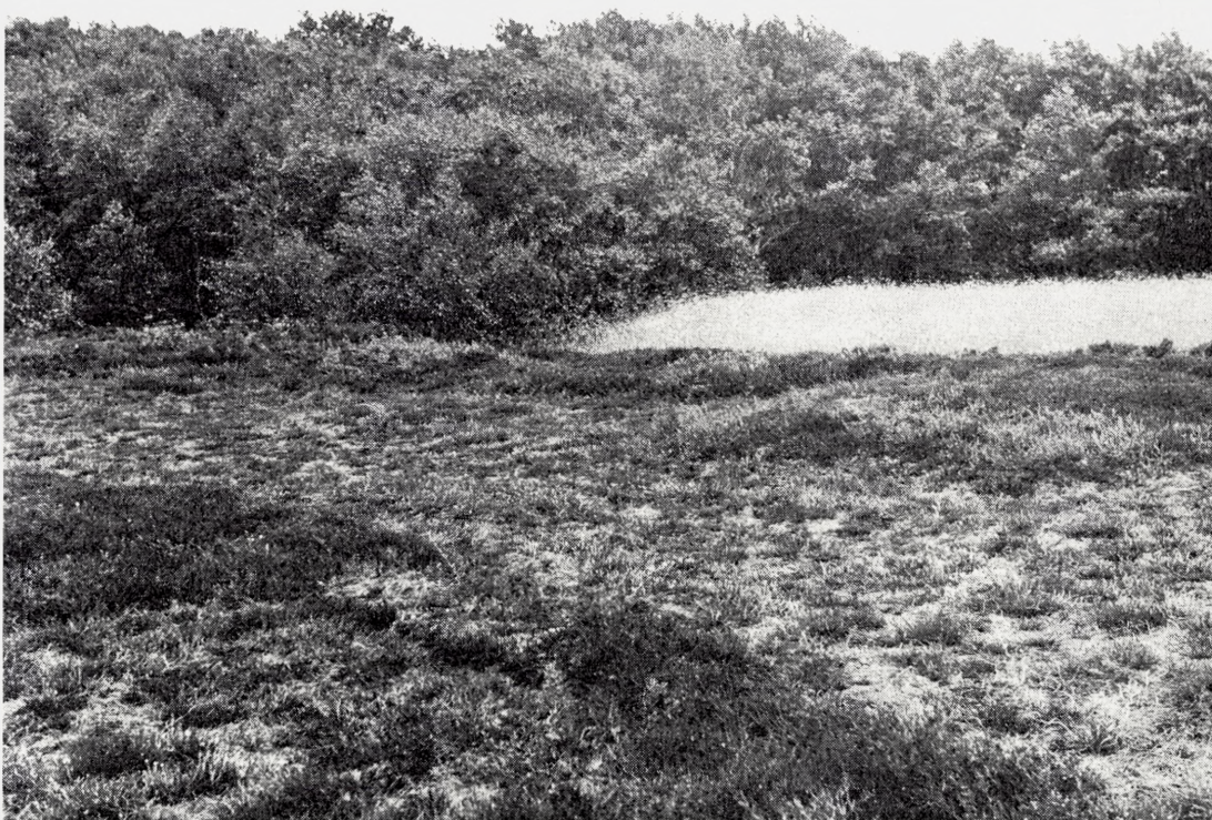
Fig. 17. På en stump hede i nærheden af Lunden nord for Byrum på Læsø er der foretaget afgravning af fladtørv. Calluna og Erica vokser frem igen, men den nøgne sandoverflade ses mellem skuddene. I forgrunden og langs rugmarken ved den lille skov ses ældre hede bl.a. med Salix arenaria .

Small heath area in the central part of the island of Læsø in Kattegat. Peat cutting and removal of peat bricks have taken place, and Calluna and Erica are colonizing on the sandy surface. In the background, a small wood and a field of rye.