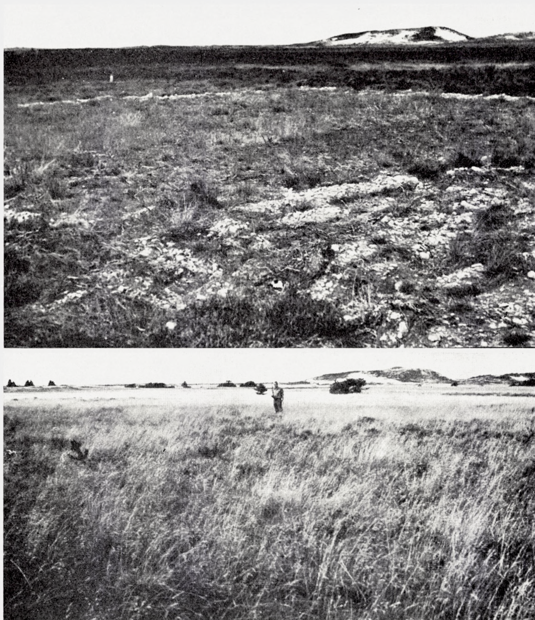
Fig. 7. Randbøl Hede forsøget. Øverst: Parcelrækken 1940 set mod vest. Skaldbakkerne med vindbrud i baggrunden. I forgrunden den skrælplojede parcel endnu med striber af blotlagt grus og småsten. Dernæst den afbrændte parcel og bagest (henimod hjørnepælen til venstre i baggrunden) den afslåede parcel. – Nederst: Omtrent samme sted i august 1971. Personen står ved samme hjørnepæl som ses på det øverste billede. Deschampsia flexuosa dominerer både på parcellerne og på hele den omgivende hede, hvor der også ses spredt opvækst især af bjergfyr.

The experimental plots in Randbøl Hede (exp. area 4) in 1940 (above), and in 1971 (below); view towards the west. On the photo from 1940 the furrows in the ploughed plot are seen in the foreground; there are still many small stones laid bare after the ploughing. Behind is the burned off plot and the mowed plot. The white concrete post is in the northwestern corner of the latter plot. The person in the bottom picture is standing by the same post. The heath has changed into a Deschampsia flexuosa community.