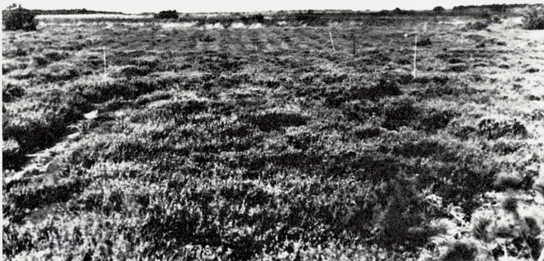
Fig. 3. Kronhedeforsøget 1953. Øverst: I forgrunden ubehandlet hede og til højre en cementpæl i hjørnet af den nordligste (afslåede) parcel, der har ensartet tæt lavt lyngtæppe. De øvrige parceller ligger bagved ned mod den lyse folkevognsbus, der skimtes længst til højre i baggrunden. – Nederst: Parcelrækken set den modsatte vej: Forrest den ubehandlede kontrolparcel, derefter ved de nedstukne tonkinstokke den skrælplojede parcel og bag den den afbrændte og den afslåede parcel. Enkelte bjergfyrbuske.

The experimental plots in Kronhede (exp. area 1 in Fig. 1) in 1953. The uppermost picture shows a low, uniform and dense Calluna heath vegetation developed on the mowed plot. – Below in the foreground the untreated test plot which is covered by a low Calluna-Empetrum-Arctostaphylos -heath rich in lichens, cp. Table 1.