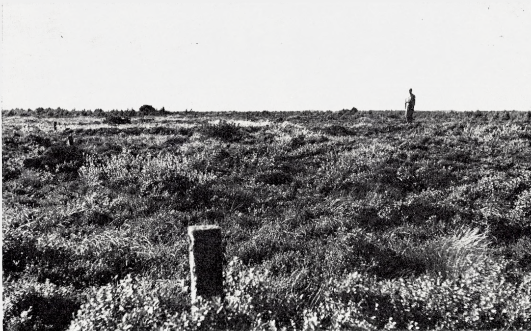
Fig. 12. Den skrælplojede parcel i heden ved Østerild i sept. 1964, 28 år efter pløjningen. De to søndre hjørnesteen ses forrest og udfør * til venstre i billedet. Personen i baggrunden står ved den nordvestlige hjørnesteen. Heden er meget uensartet. Der ses bl.a. flere pletter med kraftig Salix arenaria . TWB fot.

The lea-ploughed plot at Østerild (exp. area 6 in Fig. 1) in 1964, or 28 years after ploughing. The vegetation is heterogeneous with scattered vigorous Salix arenaria .