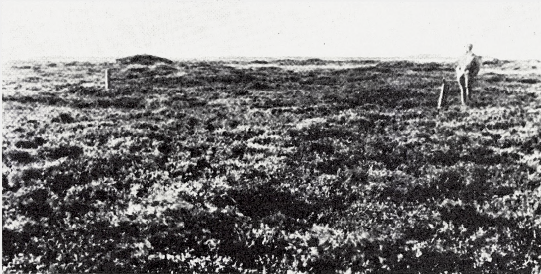
Fig. 13. Østerild forsøget. Den håndgravede parcel (3) set mod nordvest fra sydøsthjørnet. Øverst Juncus squarrosus stadiet i 1939. – Nederst samme sted i 1953 hvor parcellen præges af Calluna og Myrica gale . Den skrå cementpæl ved personen kan lige ses nær øvre højre hjørne på det øverste billede.

The experimental plot 3 at Østerild (exp. area 6) which was subject to spading. Above, initial stage with dominating Juncus squarrosus (1939). Below, later heath stage (1953) with abundant Calluna and Myrica .