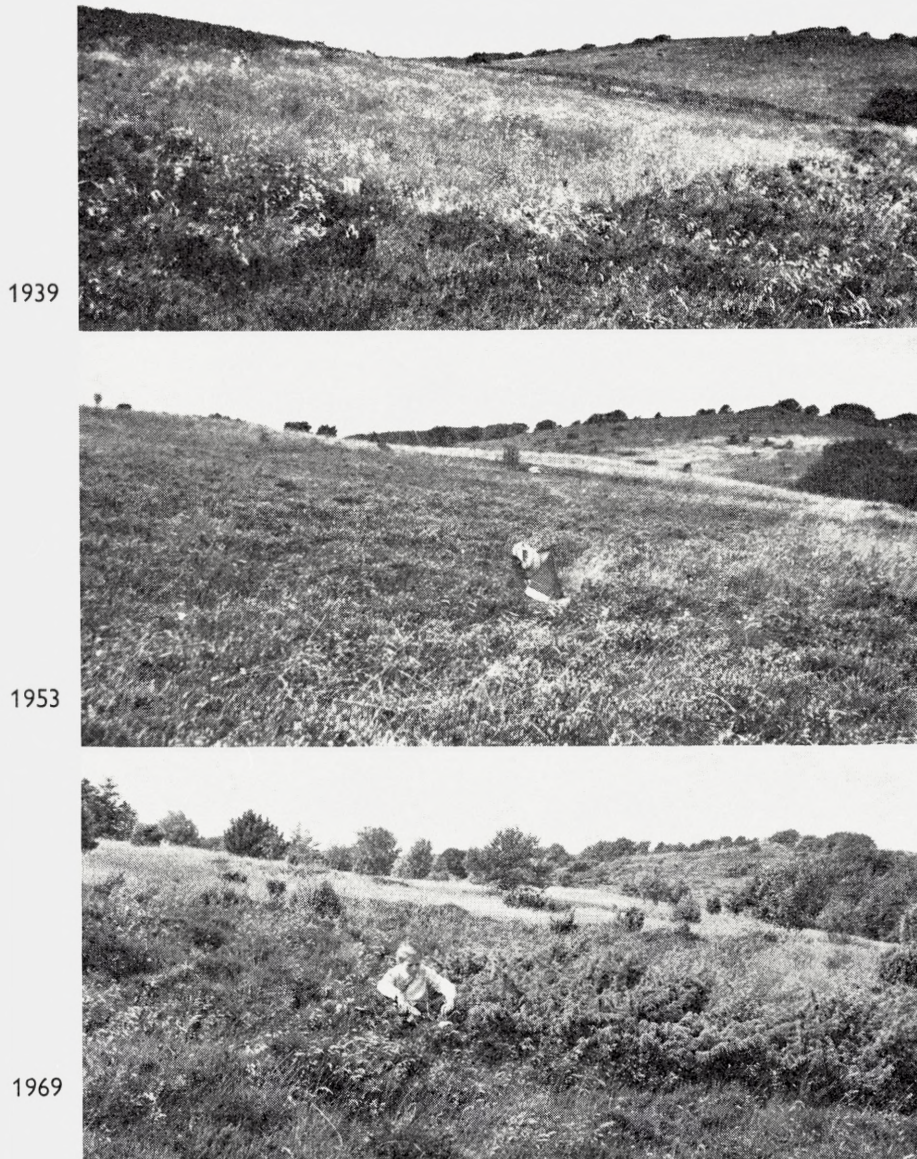
Fig. 8. Hammer Bakker forsøget set fra øst mod vest med den skrælplojede parcel i forgrunden. I 1939 præges parcellen af Carex pilulifera , Deschampsia flexuosa og Rumex acetosella , i 1953 af Calluna (samt Deschampsia o.fl. hvilket ikke kan ses) og i 1969 af Deschampsia og enorm opvækst af Juniperus , Sorbus , Pinus m.m. Drengen sidder ved hjørnepælen lige ved en stor ene uden for parcellen. På det midterste billede er hjørnepælen dækket af en kasket og en mappe. TWB fot.

The experimental plots in the heath in Hammer Bakker (exp. area 5 in Fig. 1). The row of plots is viewed from the east towards the west and the lea-ploughed plot is in the foreground. The boy in the picture from 1969 is sitting by the concrete post at the northeast corner of the plots. A successional grassland stage (1939) is followed by a Calluna stage (1953). The final stage may be Juniperus thicket with Deschampsia flexuosa or a mixed woodland.