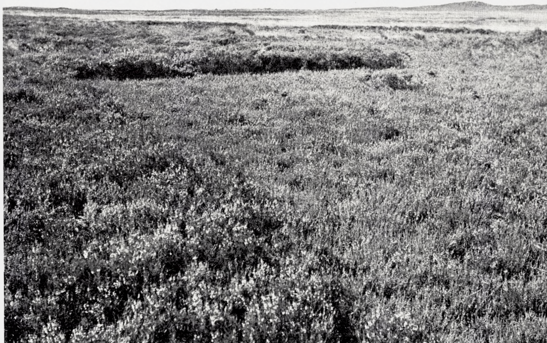
Fig. 16. Nær gården Kirstinelyst på Randbøl Hede blev der både før og under krigen slået lyng til foder. Man ser to alderstrin af kraftigt voksende ensartede lyngvegetation. TWB fot. 1938.

Area near the farm of Kirstinelyst on Randbøl Hede where the heath vegetation was mown at rather short intervals. The heather was cut in order to advance haymaking. Two age-levels of vigorously growing heather are seen on the picture.