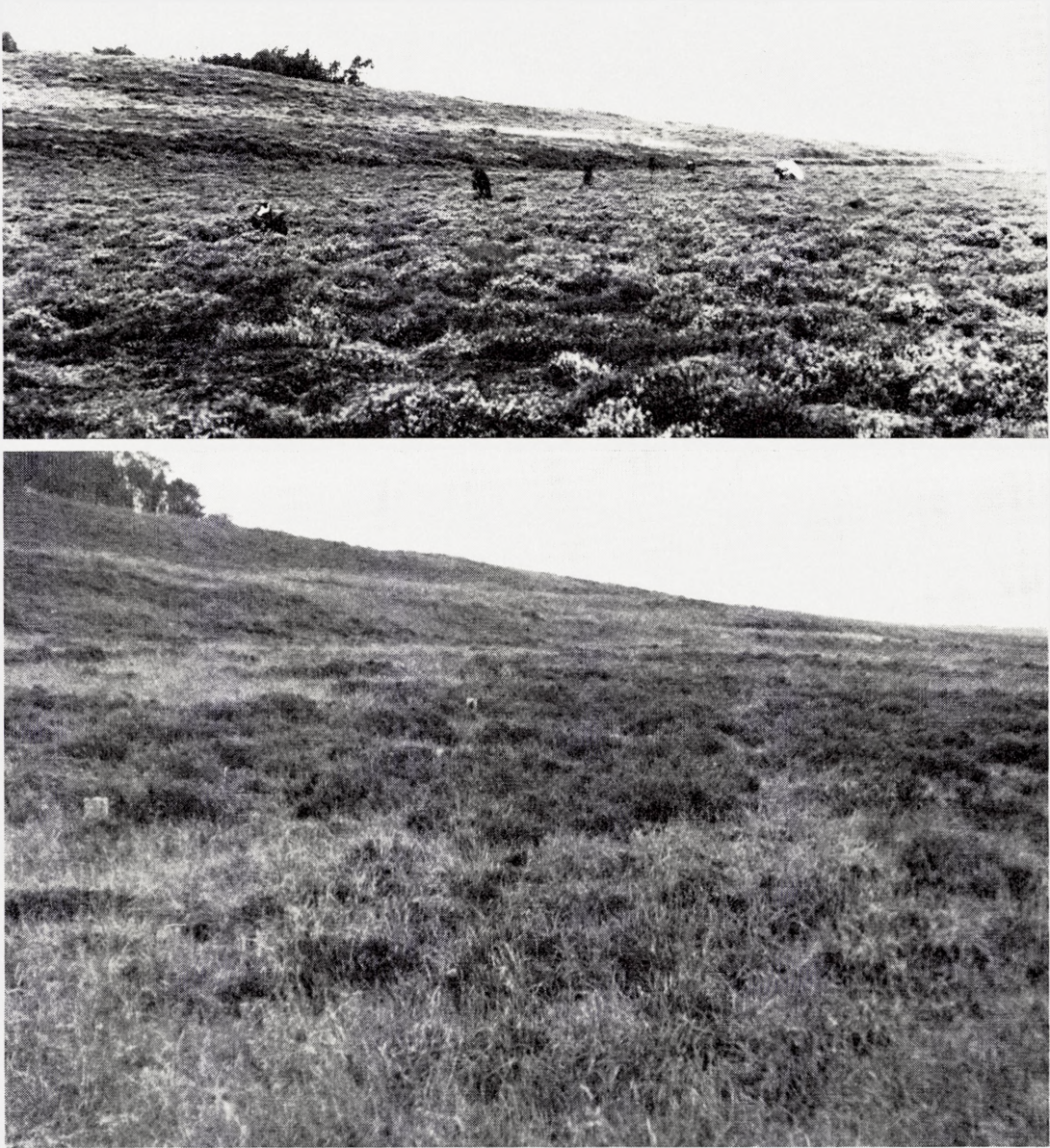
Fig. 5. Gludstedforsøget. Øverst parcelrækken fotograferet 1953 fra et punkt 15 m øst for den østligste parcel (kontrolparcellen) mod V-SV. Hjørnerne af parcellerne afmærket med nedstukne bjergfyrgrene. – Nederst samme område 1969 men med kontrolparcellen i forgrunden (græsvegetation med spredte lyngpletter). Den næste parcel har meget mere lyng og er den afslåede parcel. Denne parcels nordnordvest side markeres af de to lave cementpæle, der stikker op til højre og mere bagtil lidt til højre for midten.

The experimental plots at Gludsted (exp. area 3 in Fig. 1). The upper picture from 1953 shows the four plots in a row (corners marked by Pinus mugo branches). – Lower picture the same area in 1969. The test plot in the foreground; to the back and between the two concrete posts, is the mowed plot which still has much Calluna , while in the test plot Deschampsia flexuosa or Carex fusca are predominant.