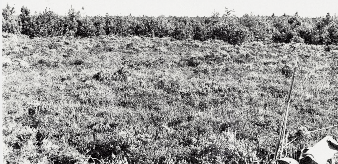
Fig. 4. Alhedeforsøget 1964. På det øverste billede ses kontrolparcellen i forgrunden. Her står lyngbuskene spredt og uensartet, medens de andre parceller har ensartet og tæt lynghede. Grænsen mellem den ubehandlede parcel og de behandlede går tværs over billedet (* - *). – Nederste billede viser den ubehandlede parcel, der er domineret af Empetrum .

The experimental plots in Alheden (exp. area 2 in Fig. 1) in 1964. The upper picture shows the test plot in the foreground (below line between the two asterisks). The mowed, the burned off, and the ploughed plots are in the background and appear darker due to the dominance of Calluna . – The test plot is also seen in the picture below; it is dominated by Empetrum and appears green with scattered patches of flowering Calluna .