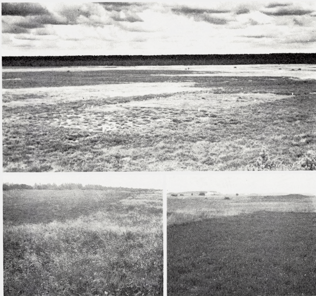
Fig. 6. Øverst: Randbølforsøget 1940. Parcelrækken set mod øst. Forreste parcel med spredte lyngtuer er den afslåede parcel, dernæst følger den afbrændte og den skrælplojede. Lyse cementpæle i hjørnerne af parcellerne. Nederst t.v. parcelrækken 1950 set mod vest. Parcellerne fremtræder som en lyngklædt rektangel omgivet af gammel hede, meget rig på Deschampsia flexuosa . – Nederst t.h. i forgrunden et firkantet område, hvor man under krigen skar fladtørv. 1950 er området tæt, mager Calluna -hede med en del Cladina i fremvækst. Omkring det kvadratiske lyngområde dominerer Molinia coerulea på et område der muligvis dyrkedes endnu for 200 år siden.

Above: The experimental plots in Randbøl Heath 1940. The mowed plot with scattered Calluna , the burned off plot, and to the far right the lea-ploughed plot all with concrete posts at the corners. Below on the left: The plots in 1950 covered with uniform Calluna heath and surrounded by old heath with abundant Deschampsia flexuosa . Below on the right: A quadrat in the heath subject to removal of peat bricks during World War II and covered with uniform low Calluna heath. Surrounding areas dominated by Molinia coerulea (probably cultivated about 200 years ago).