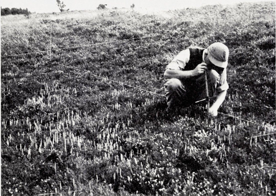
Fig. 2. Professor C. A. Jørgensen under cirklingsarbejdet 1953 i Hammer Bakker. En pind med påsat radius for de fire koncentriske cirkler stikkes ned i vegetationen ved et af de 36 krydsningspunkter i kvadratnettet. Almindelig ulvefod, Lycopodium clavatum , nåede i 1953 visse steder op på stor hyppighed og ses stikke op af det lave lyngtæppe.

The late Professor C. A. Jørgensen during work with determination of shoot density. The short cross-stick works as a radius and when turned around circumscribes a circular area of 0.1 \text{ m}^2 . The cross-stick is divided into four equally long parts, thus making it possible to distinguish four concentric circular areas. Species having shoots within the innermost and smallest circle ( 0.006 \text{ m}^2 ) are given the value 4, those inside the three other circles – 3, 2, and 1. Very dense species will continuously be given 4 values. With 25 single analyses in each experimental plot, a species of such density will get 100 in ST (shoot density). The picture shows part of the grid of 36 \text{ } 2\frac{1}{2} \times 2\frac{1}{2} \text{ m} squares; the analysis takes place in one of the 25 intersecting points indicated by a knot on the string. Lycopodium clavatum abundant in the foreground (exp. area 5).