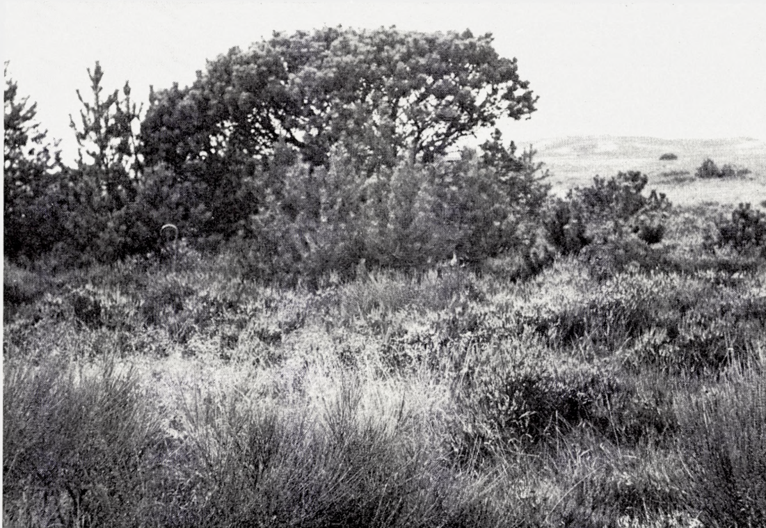
Fig. 18. Lille bjergfyrbekovning på den fredede Randbøl Hede nær ved forsøgsparcerne omtalt i tabel 4. Foran fyrrene højt voksende Calluna og den lave jyske race af gyvel. TWB fot. 1957.

Small stand of Pinus mugo on the heath reserve of Randbøl Hede near the experimental plots mentioned in Table 4. In the foreground vigorous Calluna and abundant, low growing Jutland race of Cytisus scoparius .