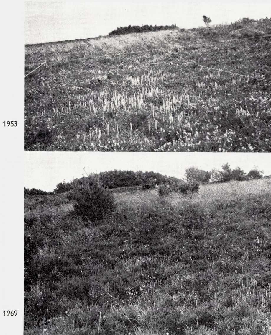
Fig. 9. Hammer bakker forsøget. Den parcel hvor fladtørv-afgravning havde fundet sted set fra vest mod øst. I 1953 var der endnu lav, græsrig Calluna -hede og på visse af de små kvadrater meget tæt Lycopodium clavatum , der ses med talrige strobili. I 1969 var der endnu lynghede på parcellen og Lycopodium -arten ses endnu. En skovfyr er groet frem nær skellet til den næste parcel (hvor lyngen blev slået af i 1937), men som nu er behersket af Deschampsia .

The plot in Hammer Bakker which was subjected to peat cutting and removal of the shallow dry peat layer. In 1953 Calluna formed a dense and low vegetation, in some squares with abundant Lycopodium clavatum . In 1969 Lycopodium was still frequent and the Calluna heath coarser. A specimen of Pinus silvestris has appeared on the border of the moved plot which is seen behind and is dominated by Deschampsia flexuosa .