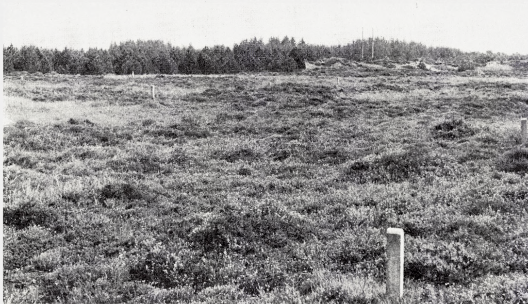
Fig. 15. Østerild forsøget. Øverst parcel 5 (den afslåede parcel) 1939. Hele feltet bevokset af Erica tetralix , idet dog Cladina -arterne ikke var blevet totalt ødelagt og var ved at vokse frem igen. Professor Mogens Westergaard står ved skelstenen mellem parcellerne 3, 4, 5 og 6. Bag ham ses parcel 6, til højre for ham parcel 3 ( Juncus -stadiet) og bag denne skimtes den parcel, hvor fladtørve var blevet skåret og fjernet (4). – Nederst: I forgrunden kontrolparcellen (6) 1971, t.v. parcel 3 (den lyse græs-star-flade), i midten og til højre, bag den hjørnepæl der ses længst til højre, parcel 5. Længst tilbage i midten parcel 2 og 1.

The experimental area at Østerild. Above, the mowed plot in 1939. Erica tetralix dominates and Cladonia sect. Cladina seems to regenerate. Behind the person is the untreated test plot 6. On the bottom picture plot 6 is in the foreground, and behind plot 3 (light area on the left) and plot 5 (on the right). Farthest away are plots 1–2.