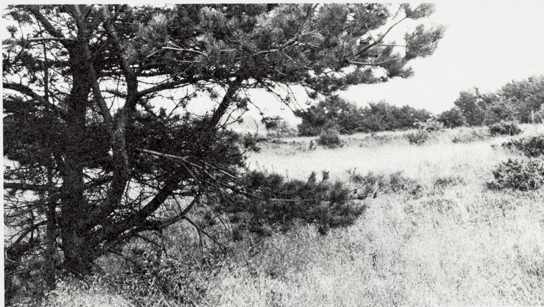
Fig. 11. Hammer Bakker 1971. Parcelrækken set fra dens vestgrænse mod øst. Øverste billede viser et kvadratisk felt med lyng, den sidste rest af den hede der efterfulgte kulturindgrebene. Heden holdt sig længst på den fladtørv-afgravede parcel i forgrunden. Tæt ved parcelens nedre, nordlige rand en stor ahorn. Skovfyrren nær grænsen til den afslåede parcel svarer til det træ der ses på Fig. 9 nederst. – Den store skovfyr på det nederste billede står meget nær parcelrækkens vestrand og nær dens øvre, sydlige rand. Billedet er således taget i den stik modsatte retning af billedet nederst på Fig. 10. TWB fot.

The westernmost plot in Hammer Bakker as seen from the west in 1971. The plot was subject to peat layer removal and maintained a Calluna heath longer than the other plots. A large specimen of Pinus silvestris near the southwest corner has grown up inside the plot (lower picture), while that of Acer pseudoplatanus (upper picture) stands a little outside and north of the plot.