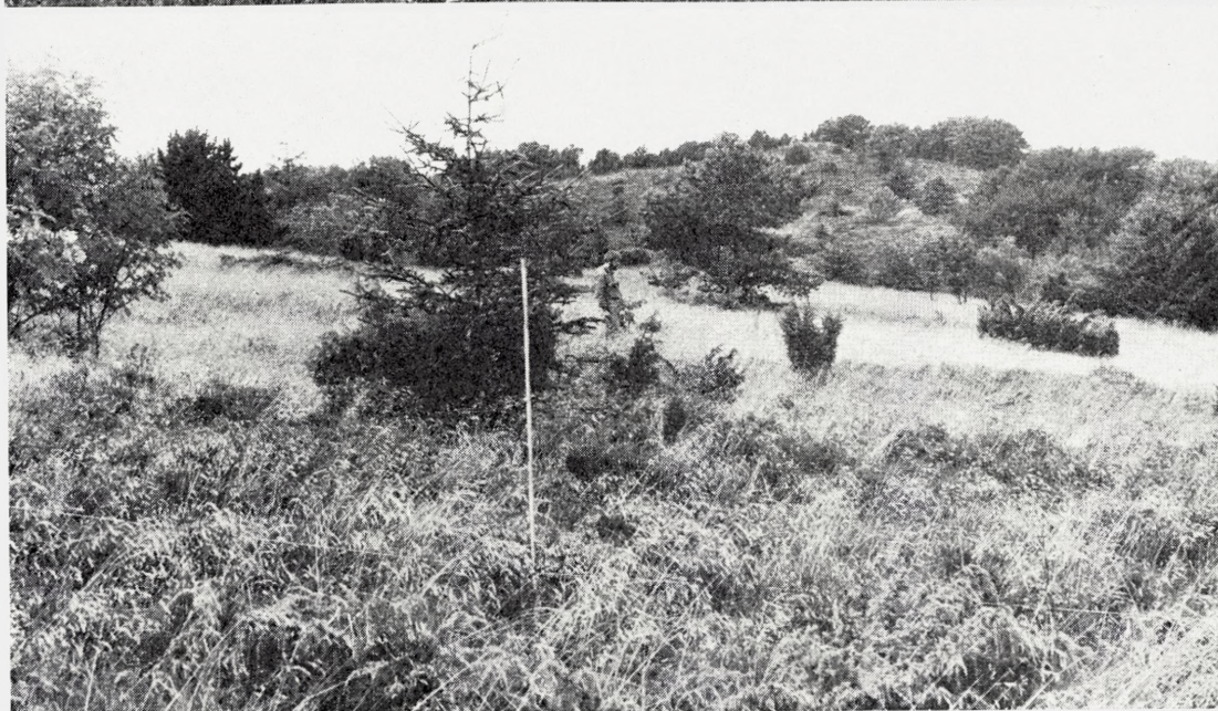
Fig. 10. Hammer Bakker. Forsøgsområdet 1969 og 1971. Øverst: Udsigt over alle fire parceller 1969. En diagonal fra parcellrækkens sydøsthjørne (ved tasken forrest) til nordvesthjørnet (ved person) skærer næsten lodret gennem billedet. Forrest skrælplojede parcel, i dens øvre rand en røn og en hvidgran. Lidt til højre for personen i baggrunden en stor ahorn, smlgn. Fig. 11. – Nederst: Omtrent samme udsigt 1971, men fotografiet viser parcellrækkens øvre og sydlige kant. Tonkinstokken står i østranden af den skrælplojede parcel, 2\frac{1}{2} m fra parcellrækkens sydøsthjørne. Personen står i parcellrækkens sydrand mellem den hvidgran, der ses på det øverste billede, og den store skovfyr på den fladtørv-afgravede parcel længst borte, smlgn. Fig. 11. Deschampsia er tydeligvis blevet langt mere dominerende i perioden 1969–1971.

The experimental plots in Hammer Bakker. Above, diagonal view (1969) of the four plots (the diagonal runs from the southeast corner at the bag to the northwest corner at the person in the background). Below the same, but looking eastward along the upper and southern border of the row of plots. The lea-ploughed plot is in the foreground. Reproduction of forest trees ( Pinus silvestris , Picea abies , P. glauca , Sorbus aucuparia ), and juniper.